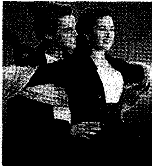
La celebre scena di «Titanic».

■ Si avvicina il centenario dell'affondamento del Titanic, avvenuto nella notte tra il 14 e il 15 aprile 1912, e si moltiplicano le iniziative per ricordare la tragedia. Al cinema, con la versione 3D del film «Titanic» di Cameron, in mare con le crociere commemorative, a terra con musical, serie tv, inaugurazioni di musei. Ma da sempre il naufragio più celebre della storia tiene banco soprattutto in libreria. In Italia sono già usciti diversi titoli. Garzanti propone il long-seller di Walter Lord «Titanic, la vera storia». Longanesi punta sul fortunato romanzo di Clive Cussler «Recuperate il Titanic», mentre Tropea rilancia «Corale alla fine del viaggio» di Erik Fosnes Hansen. E ancora, Mursia dà alle stampe il saggio dello scrittore di mare Donatello Bellomo, «Titanic, l'altra storia», che rilegge il naufragio in chiave di metafora eterna del nostro mondo. Una novità è anche «Titanic» di Claudio Bossi, raccolta di sto-